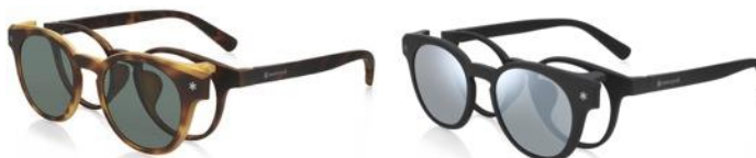
ブラウンデミ×偏光グリーンレンズ