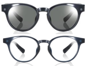
NEW ネイビー×偏光グレーレンズ