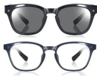
NEW ネイビー×偏光グレーレンズ